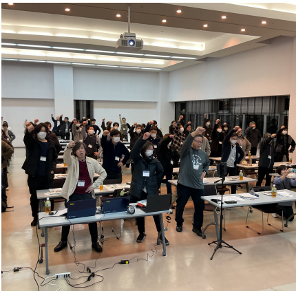
↑第44期 第1回中央委員会の様子

2026総合労働条件闘争に向けて、2月5日(木)に第1回支部長会議、2月17日(火)に第1回中央委員会を開催いたしました。