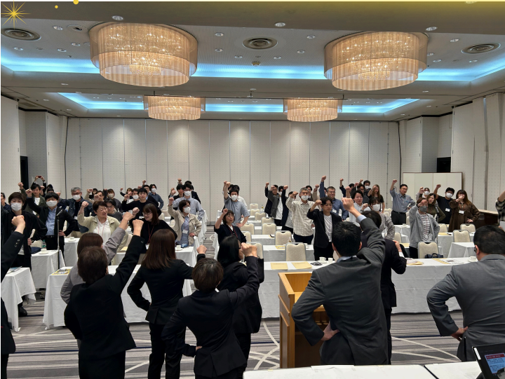
全員で一致団結、ガンバロー!