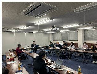
44期 第1回執行委員会開催風景

10月21日(火)、第1回執行委員会を開催しました。主な議題は「定期大会の課題と対策」「2026総合労働条件闘争におけるスケジュール確認」「職務職能等級評価表見直しに向けての進行スケジュールの確認」「私の主張参加弁士立候補について」の4項目です。