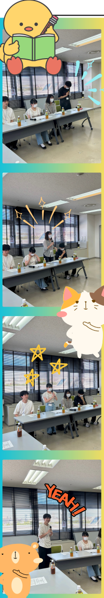
参加者からの質問タイム