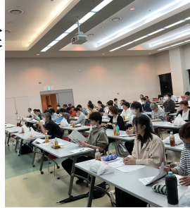
第5回支部長会議開催風景②

第44期はその中期ビジョンの実現に向けて、組織を事業局と書記局に2分する組織改編を行い、支部組織活性化、支部オルグ強化、ホームページ刷新、労使交渉の発展、事業活動の発展を図り、実現にまい進していく方針(案)を報告させていただきました。