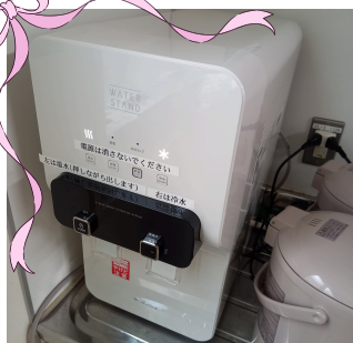
こちらは中野山店の設置状況です 各店に順次設置していく、 とのことですよ

各店舗にウォーターサーバーの設置が進められております。10月もまだまだ熱中症に気を抜けない時期ですので、こまめな水分補給で対策をお願いします。販売部より水分補給に関する項目を追加した休憩ルールが発信されておりますので、そちらもご確認ください。