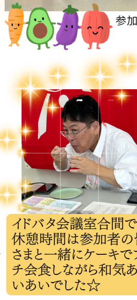
イドバタ会議室合間での休憩時間は参加者の皆さまと一緒にケーキでプチ会食しながら和気あいあいでした☆

1985年、18歳でウオロクに入社し、勤続40周年。入社後、青果担当者として小針店に配属。神道寺店や大学前店、松浜店などで青果主任として勤務し、1994年に青果バイヤー(果実担当)に着任。1995年には豊町店(立地移転前の現東新町店)の青果主任とバイヤーを兼務。2010年、新設されたばかりの地場産直担当バイヤーに着任し、今年で16年目!! 趣味は推し活☆