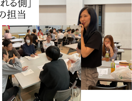
ディスカッション風景

執行部からの説明終了後、人事評価や評価後の面談についてグループディスカッションを行いました。今回は部門に関係なく、「評価する側・評価される側」の主任職と「評価される側」の担当