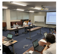
労使協議会開催の様相

本社にて7月28日に第11回労使協議会を開催いたしました。会社側より6月単月および累計の業績報告がありました。「経常利益は累計では予算を超えているが、昨年対比では非常に厳しい実績になっている。」との報告も受けましたが、7月9日に改装オープンした緑店を含めて新発田エリアは想定以上に好調で、組合員に対して労いの言葉がありました。また、インターバル規制違反については違反件数や内容(店舗改装対応)から周知は進んでいるとの見解が示されましたが、今後の改善へ向け課題認識の共有をしました。