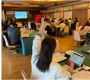
第4回 支部長会議の様

4月9日(水)第4回支部長会議を開催いたしました。初めに執行委員長より2025総合労働条件闘争のご協力のお礼を伝え、今回の労働条件改定によって変わった点について改めて報告を行いました。改定の詳細は闘争情報vol.4でご確認をお願いいたします。また、グレードアップしたウオロクユニオンライフサービスについて、登録方法や新たな優待内容のご紹介をさせていただきました。皆様の支部にもお邪魔して説明や登録のお手伝いをさせていただきますので、わからないことがあればお気軽にお聞きください!