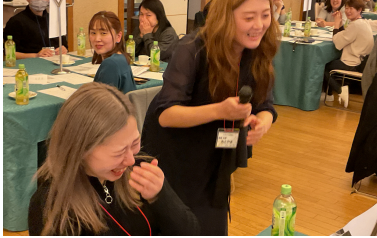
第43期 組合研修会開催の様子