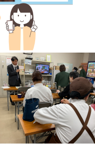
順次、説明会実施中です☆

ウオロクユニオンライフサービスのグレードアップにつきまして、新しいアプリの登録が必要です。それにとともに、現在各支部休憩室にて説明会を開催し、登録のお手伝いやアプリの活用法をご案内しています。休憩のない短時間勤務の方もご参加いただけます。アプリの便利な機能を知っていると受けられる優待が増えます。登録がお済みの方もそうでない方もぜひご参加ください！ つかわずじまいはもったいない！