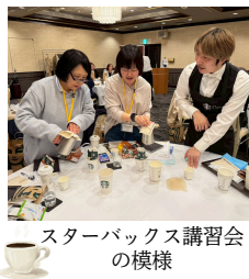
スターバックス講習会の様子

後半ではセルフケアの一環としてスターバック様より選りすぐりのバリスタチームを招いて美味しいコーヒーの淹れ方講座を開催して各組合の方々とは新たなコミュニティで盛り上がりました。この日はみんな笑顔でストレスなど忘れて和気あいあいです。