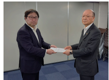
第8回労使協議会にて電子化運用要望書を提出

4月28日(月)本社にて第8回労使協議会を開催しました。会社側より「昨年度は増収増益で終えられたことは組合員の皆さんの頑張りのおかげ」と感謝の言葉がありました。