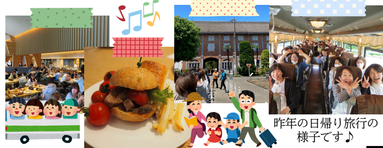
昨年の日帰り旅行の様子です♪

今年の日帰り旅行は 「福島県 会津若松で名産を巡る旅 ～磐梯熱海温泉 華の湯 旅するランチビュッフェ～」 です。昨年の日帰り旅行でもランチビュッフェは好評でしたので、今年も楽しみです。今回は久しぶりの会津若松です。多くの組合員さんとお会いして、たくさんお話をしたいと思います。日帰り旅行に参加していただく皆さん、日頃の疲れを癒しに行きましょう♪ 旅行の様子は後日新聞でもお伝え予定です。お楽しみに！