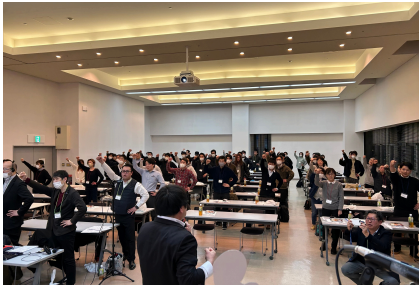
第43期 第2回中央委員会 開催の様子