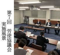
第7回 労使協議会 実施風景