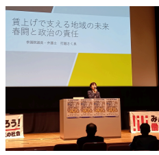
連合新潟2025春季生活闘争 新潟県中央総決起集会 開催模様

2月27日(木)にユニゾンプラザにて新潟県中央総決起集会が開かれ、各支部有志が集まり、賃上げの決意を新たにした。新しい社会を築いていくために、賃上げを求め、労働条件の改善を求め、社会の発展に貢献する。私たちは、賃上げを求め、労働条件の改善を求め、社会の発展に貢献する。私たちは、賃上げを求め、労働条件の改善を求め、社会の発展に貢献する。