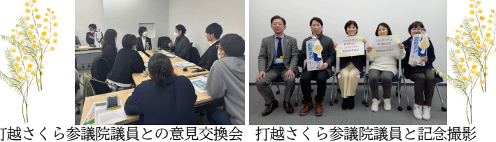
打越さくら参議院議員との意見交換会 打越さくら参議院議員と記念撮影