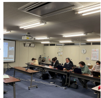
第6回 労使協議会 実施風景

3月25日(火)の第7回労使協議会で会社側より再検討の結果、正社員組合員の賃上げは定期昇給とベースアップ、職責職務手当改定分を含めて17,644円(6.03%)、シニアF社員組合員は65歳未満で定年制度改定前に退職した社員に対し一律8,000円、65歳以上の社員に対して一律5,000円、定時・P社員組合員は職務職能等級評価のほかに40円(初任時給1,060円)をベースアップする回答がありました。また、定時・P社員組合員の職務職能等級ではP1級を20円、P2級を10円、職務加算給では主任職とリーダーパートナーを各10円増額、シニアP社員においては20円のベースアップに加えて日曜加算給を支給すると回答もありました。その後休憩を挟み、第7回執行委員会内で2次回答の内容を基に意見集約を行いました。ベースアップの割合は評価しつつも、課題が残る生鮮DCの土曜製造負担と正月三が日営業については今後も協議を続けていく旨を確認して、第7回労使協議会を再開したなかで2025総合労働条件闘争を妥結としました。連合新潟内では平均5.4%の賃上げに対して、ウオロクは6.03%の大幅な上げ率としたことは会社側でも非常に大きな決断でありました。合わせて期末の特別賞与の付与は利益の均等配分という意味でも従業員を大切にしたい会社側の想いでもあります。