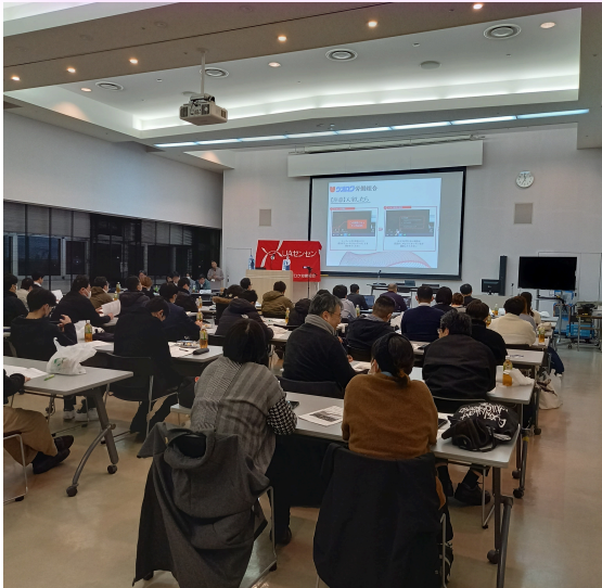
第43期 第1回中央委員会開催の様子

2月4日(火)に新潟ユニゾンプラザにて「第43期第2回支部長会議」を開催しました。