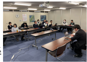
執行委員会開催の様子