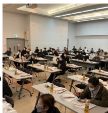
第2回 支部長会議 実施風景

今回の要求項目は過去1番で多く、内容も多岐に渡り、いかに交渉を進めていくかが注目されています。左記項目以外でも最近では記憶に新しい大雪時の対応も課題に上がっていました。全従業員の出勤・帰宅の安全確保の観点から営業時間短縮など早めの対応も求められました。