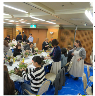
みずの講師と一緒にギャザリング風景

参加者の皆様から「難しかったけど楽しかった」と多くの声が聞けてよかったです。次回は今回参加されなかった方にも参加していただけるセミナーを開催したいと思います。多くの参加をお待ちしています。