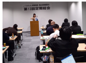
外部団体と研修会の模様

少し前になりますが10月にUAゼンセン新潟県支部男女共同参画委員会定期総会がありました。新潟県内に所属する各UAゼンセン新潟県支部組合より選出された役員が集まり、2025年に向けての活動計画を決議しました。今後は「協働参画委員会」と名称あらため「職場におけるジェンダー平等の実現」「ワークライフバランスの実現」「組合活動における協働参画の実現」の3つの目標達成に向けて活動していきます。総会後は育児休業における「改正育児・介護休業法」について勉強会とグループディスカッションを実施しました。どの企業におかれても育児・介護休業は共通課題であった印象が強かったです。詳細はまた別の機会に記載していく予定です。