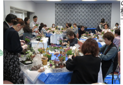
レディースセミナー開催の様子