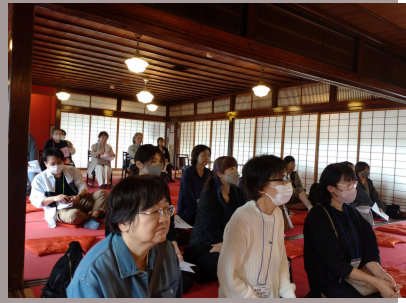
第2陣の参加風景 その②