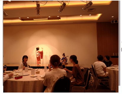
第2陣の参加風景 その①

第2陣は第1陣よりも多い59名の参加者がいらっしゃいましたが、第1陣の反省点も改善され、参加者の皆様のご協力もあって、スムーズに旅行を楽しむことができました。今回の日帰り旅行が組合行事への初参加という組合員さんもいらっしゃり、一緒に参加した仲間だけでなく、久しぶりに会う方、はじめましての方