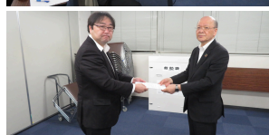
要望書を提出しました

10月28日、本社第1会議室にて労使協議会および執行委員会を開催しました。労使協議会では9月単月の業績と生産性を確認しました。単月ではイレギュラーな経費(緑店の減価償却費計上分、電気料金の増加、最低賃金改定における給与の拡大など雑給の増加)がかかった分、利益面で前年割れが起きました。しかし上期累計では売上・利益ともに昨年を上回っています。先日行われた衆院選の結果、政治の先行きや株式・円相場の不透明性はさらに広がると思われます。環境や働き方が変わっていくなかで今一度、仕事の実態内容が評価項目とずれがないか見直しをかけるべく会社に対し、「職務職能等級見直し要望書」を提出しました。