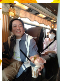
移動中も楽しく くつろぎます!

第一陣の40名の参加者は、9月9日に最高の天候に恵まれ、贅沢な時間を過ごしていただき、非日常を堪能してもらいました!