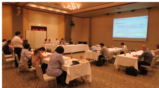
執行委員会の様子

8月23日(金)執行委員会を開催しました。今期の活動報告の作成と、来期第43期の活動方針案をまとめました。また、第43~44期2年間の活動目標となるスローガン(案)についても議論しました。今期の活動の点検は、全体的な一般活動として重点的に取り組んできた「労働環境改善のための活動」、「組織の従実、強化」、「組織の成長のための活動」について、また、専門部や分科会活動についても振り返りをし、取り組んだことを活動報告として、そして、新しい第43期に重点的に行う活動方針については、専門部活動を含め一般活動方針やその執行にかかる予算や規約の改正を活動方針の議案としてまとめています。組合員皆さんへ「第43回定期大会 報告・議案書」として大会開催前に配布しますので、内容をよく読んでいただき、参加代議員には、支部長を中心に支部の総意をまとめて大会の審議に臨んでほしいと思います。