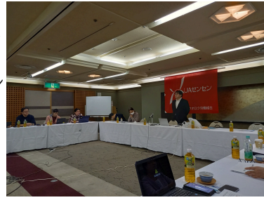
執行部研修会の様子

上がり続ける物価に対する賃金とのバランスで安定的な賃金上昇を確保することはデフレが終息し、縮小均衡から離れる絶好のチャンスでもあります!